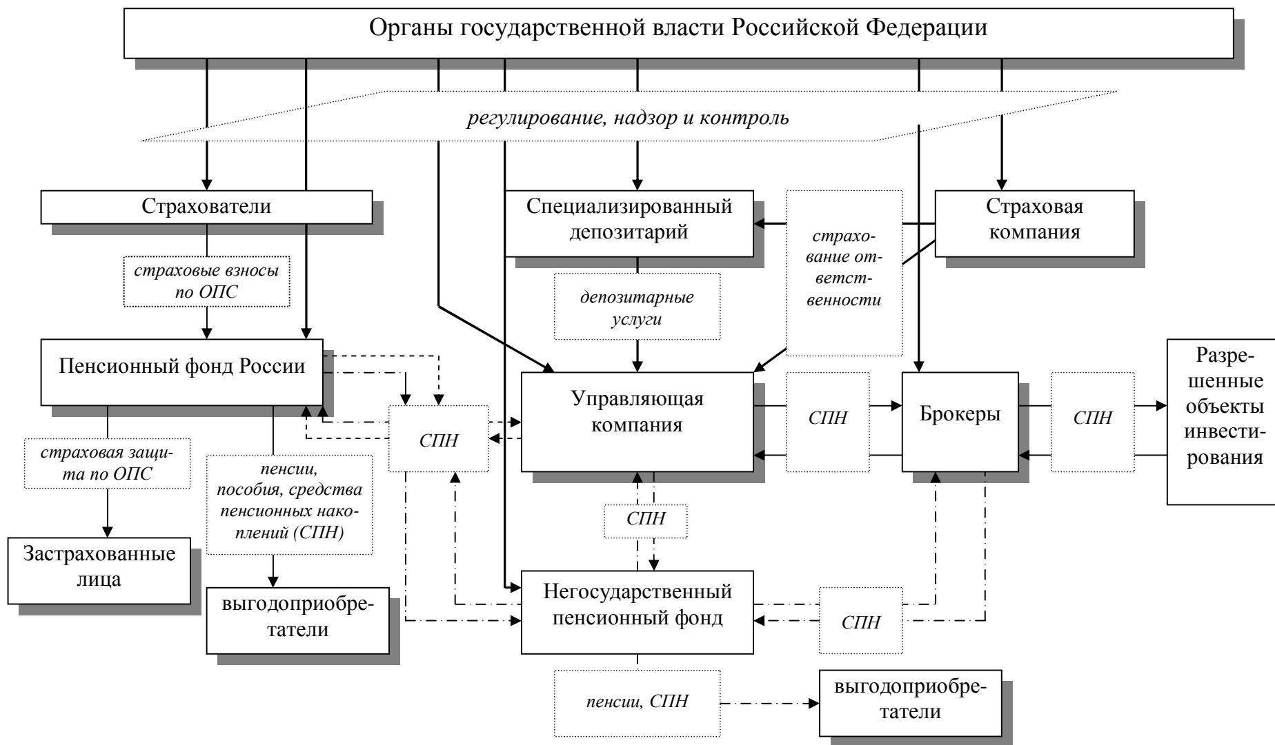
Рис. 2. Механизм обязательного пенсионного страхования России