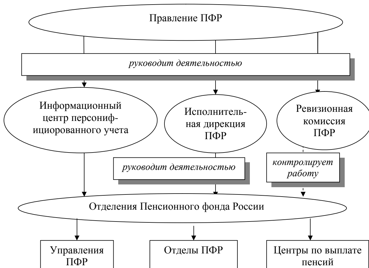
Рис. 1. Организационная структура Пенсионного фонда Российской Федерации

Правление ПФР правомочно принимать решения, если на заседании присутствует не менее половины его членов. Решения Правления ПФР принимаются простым большинством голосов от числа присутствующих.